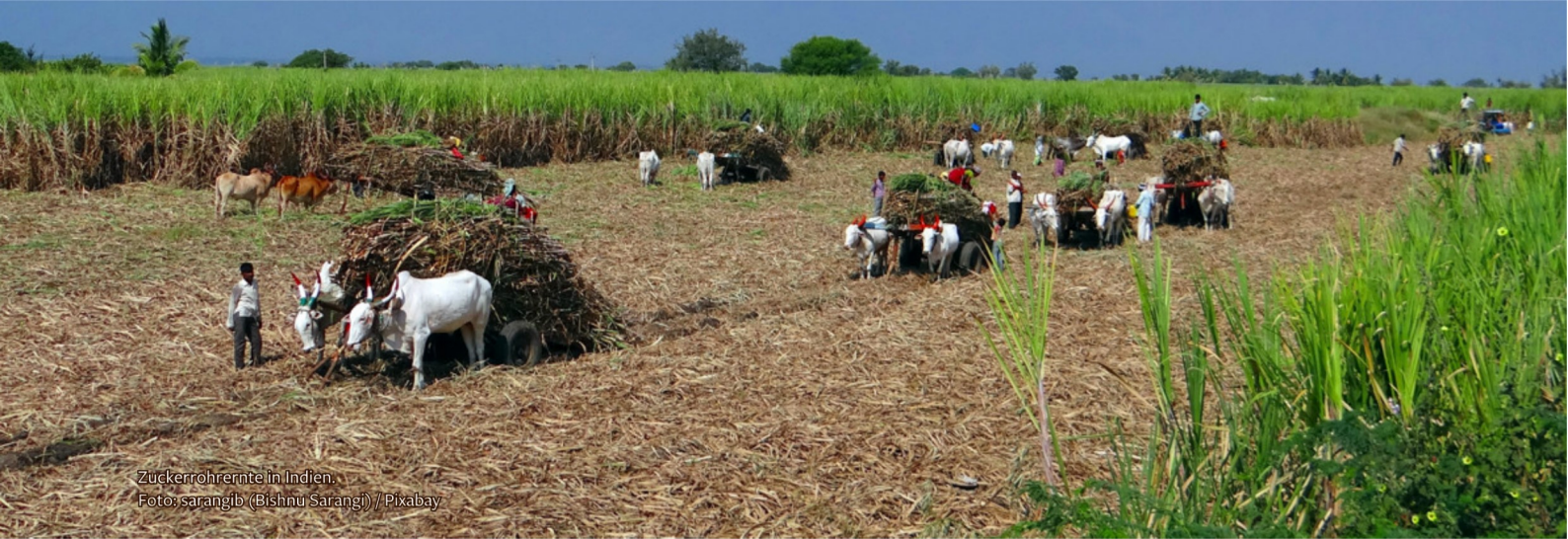
Zuckerrohrernte in Indien.