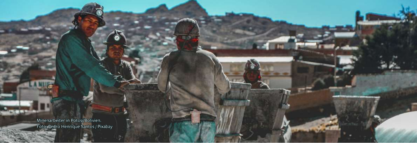
Minenarbeiter in Potosí/Bolivien.