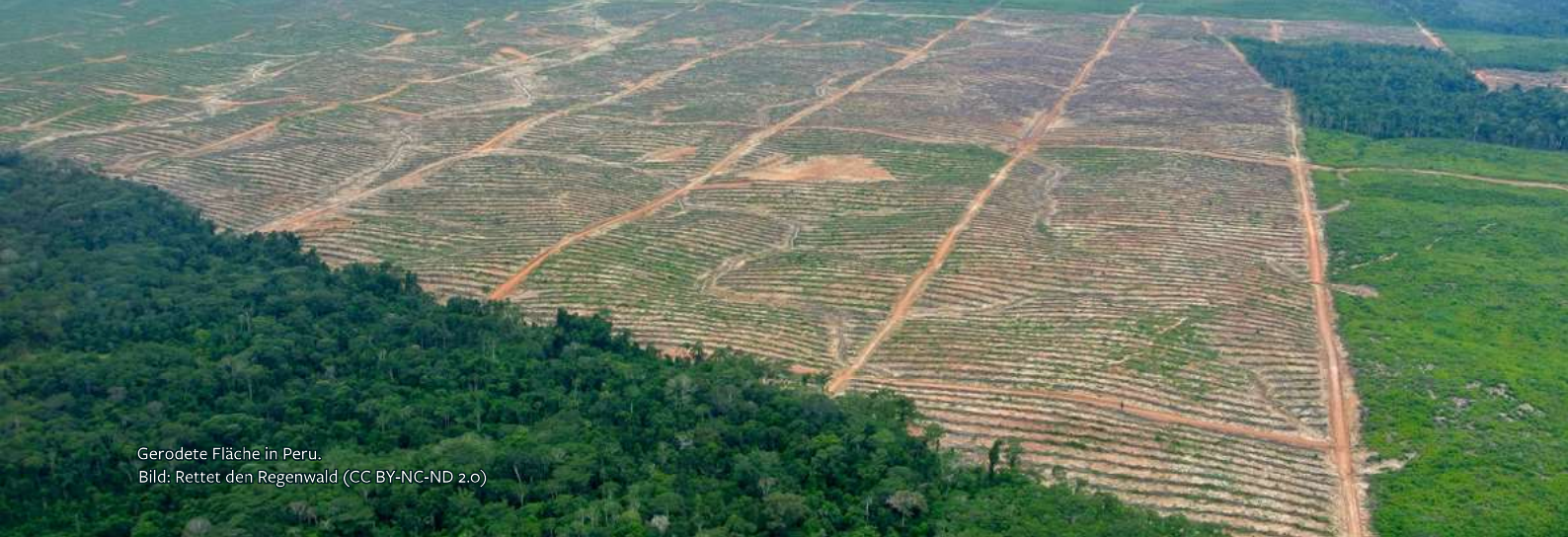
Gerodete Fläche in Peru.