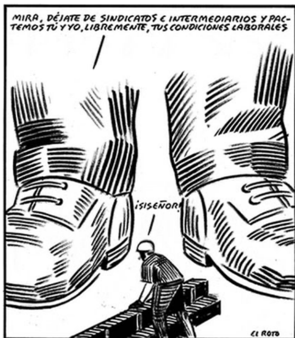
Übersetzung des Bildes "Lass das mit den Gewerkschaften und Vermittlern. Du und ich machen ganz frei deine Arbeitsbedingungen aus" - "Ja, Chef!"

Die Liberalisierung des Handels und die Förderung von Exporten waren und sind nicht neutral, sondern haben je nach Klasse, Betroffenheit von Rassismus, ethnischer Zugehörigkeit und Geschlecht unterschiedliche Auswirkungen, die bei einer abschließenden Analyse berücksichtigt werden müssen. Frauen und LGBTQ+-Personen, Angehörige ethnischer Minderheiten, Indigene, Landarbeiter*innen und Migrant*innen sind am stärksten betroffen und leiden am meisten unter den Folgen.