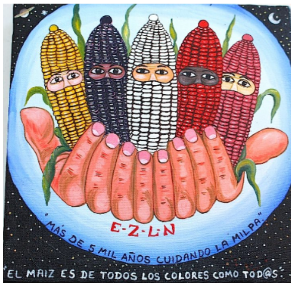
Foto: Wandbild der EZLN, auf dem jedes Gesicht eines zapatistischen Kämpfers von einem Maiskolben umrahmt wird.

Der Bankrott tausender Bauern und Bäuerinnen hat zu einem Prozess des Widerstands und der Organisation gegen den Freihandel geführt. Die Zapatistische Nationale Befreiungsarmee (EZLN) verließ am 1. Januar 1994 den Lacandon-Dschungel, um unter dem Ruf „Ya Basta!“ („Es reicht!“) die Hauptorte des Bundesstaates Chiapas zu besetzen, genau an dem Tag, an dem das NAFTA-Abkommen in Kraft trat. Seitdem hat sie sich in autonomen Gemeinschaften organisiert, die als „Caracoles“ bekannt sind und in denen sie unter anderem Produktionsprojekte zur Aufrechterhaltung der bäuerlichen Lebensmittelproduktion durchführt.