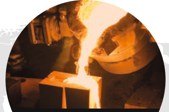
Verarbeitung Bauxit zu Aluminium

Deutschland ist weltweit der drittgrößte Nachfrager von Aluminium – 92% seines Bedarfs am Aluminium-Grundstoff Bauxit importiert Deutschland aus Guinea.