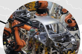
Weiterverarbeitung zu Autos