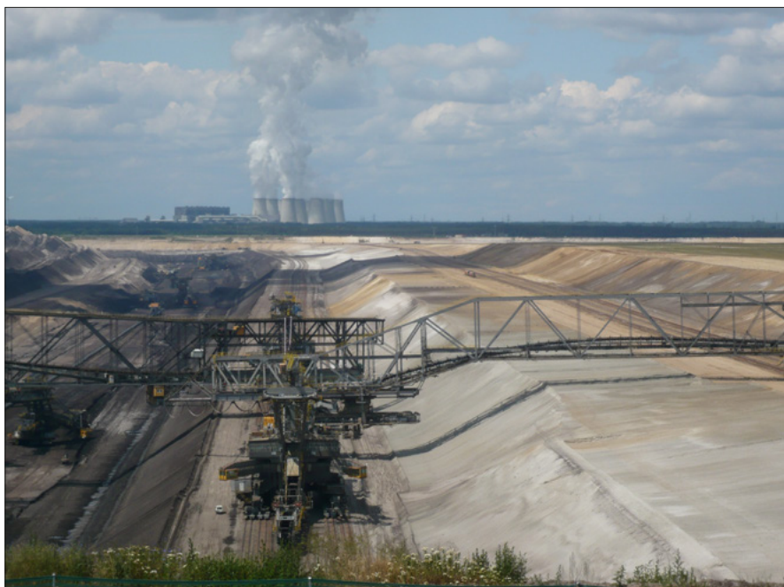
Schlecht für Wasser, Luft und Gesundheit: Braunkohletagebaue und -kraftwerke

Das Wasserwerk Friedrichshagen am Müggelsee, das ein Viertel der BerlinerInnen mit Trinkwasser versorgt, entnimmt seinen Rohstoff größtenteils aus dem Uferfiltrat der Spree. Dort wird der offizielle Grenzwert von 250mg/l für Sulfat im Trinkwasser immer öfter überschritten. Aktuelle Messdaten belegen, dass die Werte im Müggelsee im Sommer 2015 dauerhaft über 250 mg/l lagen und teilweise sogar 300 Milligramm überschritten – Tendenz steigend. Schuld an den erhöhten Sulfatwerten sind die Braunkohletagebaue in der Lausitz: Durch den Kohleabbau verbinden sich